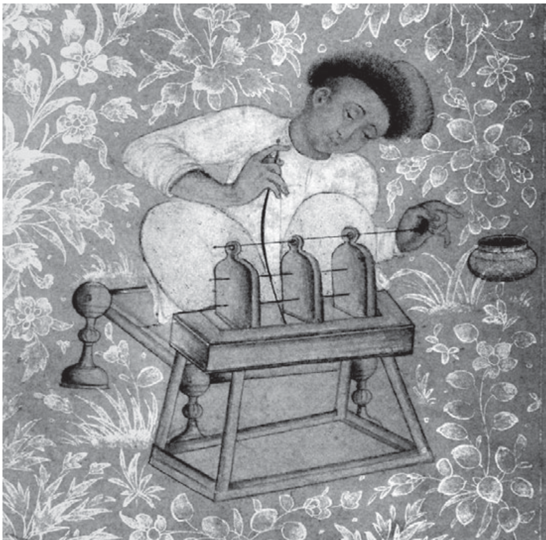
تصویر الف - برگی از یک مرقع به نام جهانگیرشاه گورکانی که در آن شیوه کار با دستگاه حکاکی سنگ‌های قیمتی و نیمه قیمتی نشان داده شده است. ۱۶۲۰، موزه فرهنگ‌های آسیایی، آفریقایی و آمریکایی پراگ، ماخذ: Porter, 2011, 188