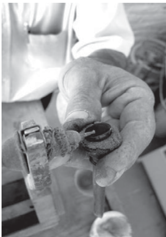
تصویر ۱۰ - چگونگی تماس نگین و تیغه الماسه در حکاکی با دستگاه عقیق‌کن