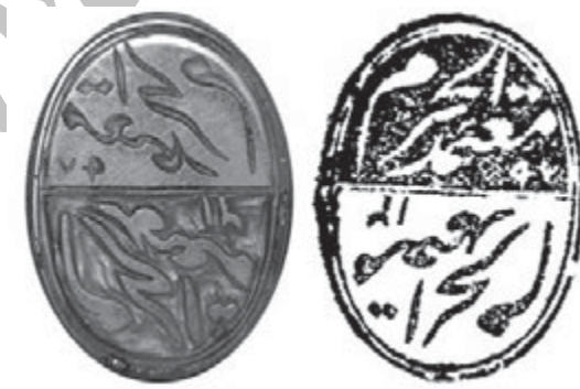
تصویر ۶- اصل و اثر مُهر بیضی شکل عقیق با سجع: «معمدالحرم ۱۲۹۲ ق»، این مُهر را به شیوه گود و برجسته حکاکی کرده‌اند و سجع آن تکرار شده است، ماخذ: جدی، ۱۳۹۰، ش ۴۸۲۴

توضیح شاردن مربوط به پرداخت نگین‌ها و مُهر انگشتری‌هاست در حالی که رحمتی بن عطاء الله در این مورد از پرداخت و اصلاح مُهرهای فلزی سخن گفته است. در دوره قاجار و پهلوی نیز مهم‌ترین شیوه حکاکی به همین