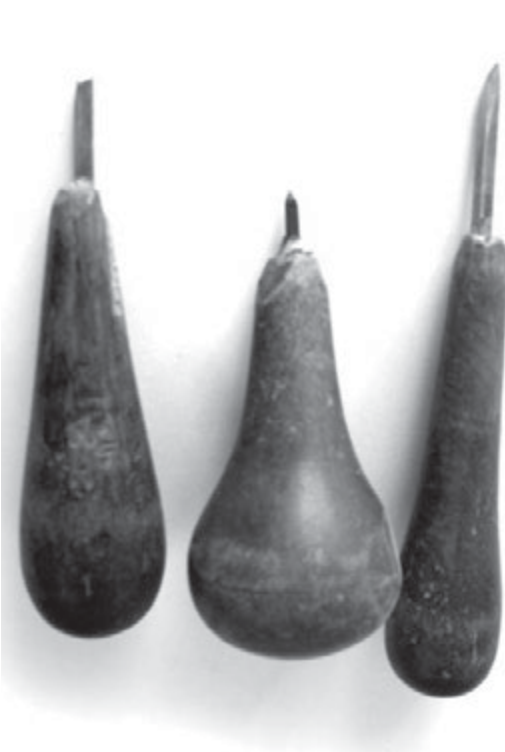
تصویر ۵- قلم فولادین برای حکاکی مُهرهای برنجی (فلزی)، قدمت قاجاریه، مجموعه خاندان حمیدی حکاک شیرازی، ماخذ: نگارندگان

۴- نگین‌های مجزا که نقش مُهر اسم را ایفا می‌کند و دسته و قابی متمایز از انگشتری دارد.