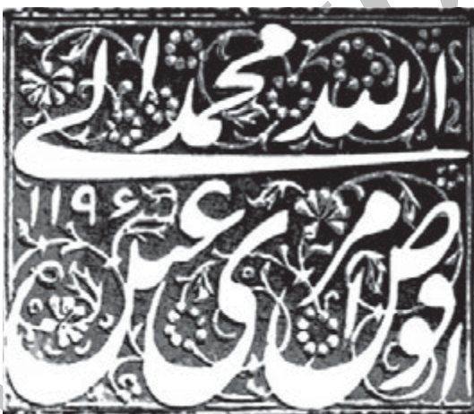
تصویر ۲- (بالا) اصل و اثر مُهر چهارگوش عقیق با سجع: «لا اله الا الله ملك الحق المبين، عبده ابوالقاسم، ۱۲۷۴ ق»، (پایین) اصل و اثر مُهر چهارگوش برنجی محمدشاه قاجار با سجع: «افوض امری الی الله، عبده محمد، ۱۱۹۶ ق»

گاهی آن‌ها را از هرگونه آمادگی پیشین بی‌نیاز می‌ساخت و معمولاً در بداهه خود، هم زمان هم ترکیب را می‌نوشتند و هم در واقع آن را حک می‌کردند. شیوه دوم نیز خاص مُهرهای سفارشی بوده است.