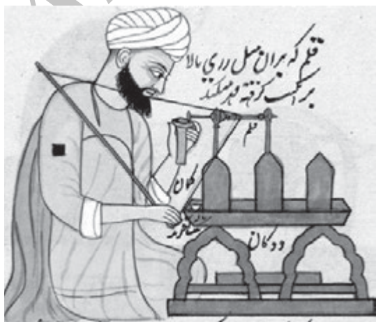
تصویر اب - برگی از نقاشی که یک حکاک کشمیری را در حال حکاکی کردن با دستگاه مخصوص حکاکی سنگ‌های قیمتی و نیمه قیمتی نشان می‌دهد

بوده است مساحت این صفحه نیز بسته به میزان متن و نوشتار مُهر، ضخامت قلم و سلیقه حکاکان در ترکیب، در نوسان بوده است. اما معمولاً الگویی واحد برای مُهرهای عمومی با اندازه‌های سه تا پنج سانتی‌متر - حداکثر هفت سانتی‌متر - از درازا در نظر گرفته‌اند و آن گاه تعدادی از آن را تکثیر و در اختیار حکاکان قرار می‌داده‌اند. از طرفی متن و اندازه قلم ترکیب در این مُهرها با گنجایش صفحه مُهر نسبت داشت و تغییر در آن نیز به اختیار حکاک بود. برای مُهرهای خاص، عکس این ماجرا صادق است. به این معنا که حکاکان ابتدا حدود متن و ترکیب را مشخص می‌کردند و طبق آن، سفارش قالب می‌دادند. ریخته‌گری خام مُهرهای برنجی را گاه در کارگاه‌های زیورسازی انجام می‌دادند. این کار به سفارش حکاکان اما به دست استادکاران جواهرساز به‌انجام می‌رسید، هرچند ممکن بود حکاک خودش نیز این کار را انجام دهد. (تصویر ۴)