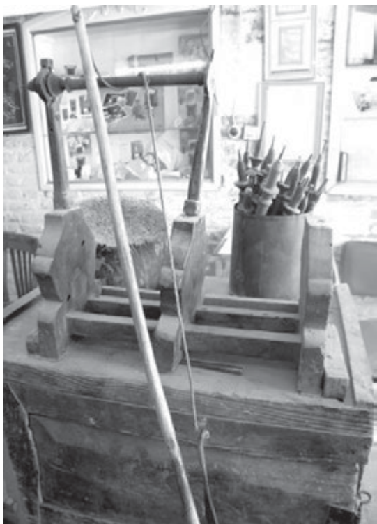
تصویر ۷- دستگاه عقیق‌کنی با لوازم جانبی، قدمت قاجاریه، مجموعه خاندان حمیدی حکاک شیرازی، ماخذ: نگارندگان