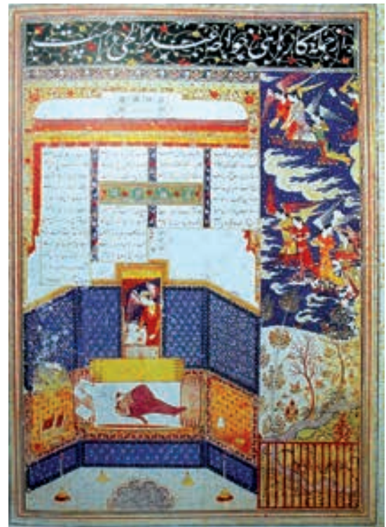
تصویر ۳- در خواب فرشته (جبرئیل)، ورق جدا شده از آلبوم بغداد، بدون رقم، منسوب به عبدالحی، سال ۱۳۹۶، اندازه ۲۸/۵×۱۹/۵ سانتی متر، موزه توپقاپی استانبول

امالی شیخ صدوق، احتجاج طبرسی، وسائل الشیعه شیخ حرعاملی و مستدرک محقق نوری نیز به معراج اشاره شده است.