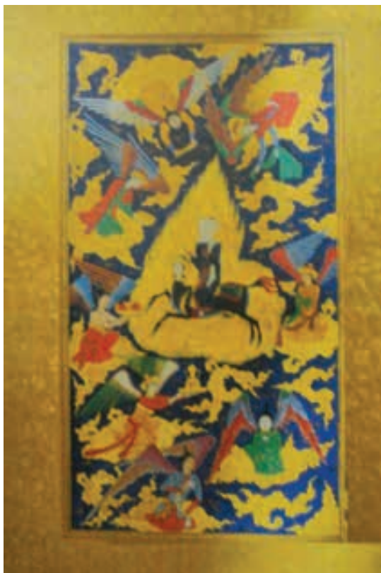
تصویر ۱۰- معراج، حبیب السیر خواندمیر، کاتب نا معلوم، موزه کاخ گلستان