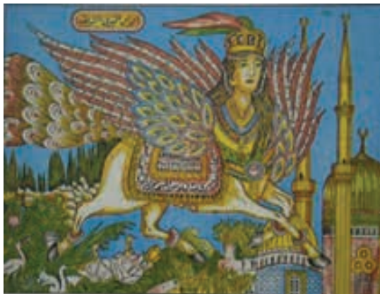
تصویر ۲۴- مصر، البراق نورالشریف، ۱۹۶۰، بدون رقم

در سال ۱۲۲۴ میلادی در آنتولی اقامت گزیدند. این گروه مهاجر در خانواده سلجوق پذیرفته و بعدها دارای مقام عالیه اداری شدند. در سال ۱۳۰۰ میلادی سلسله پادشاهی عثمانی بنیان گذاشته شد و تا سال ۱۹۳۶ میلادی ادامه داشت. (کارل جی، ۱۳۶۳، ۱۴۹)