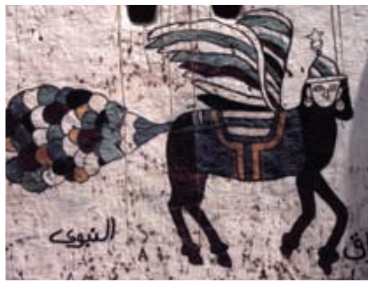
تصویر ۲۶- مصر، براق، هنر مردمی، بدون رقم، ماخذ: همان، ۱۴۹

سبز و حاصل خیزی را در این پهنه خشک و سوزان ایجاد نموده، به همین دلیل می توان آن را شاهرگ حیاتی تمدن مصر دانست.