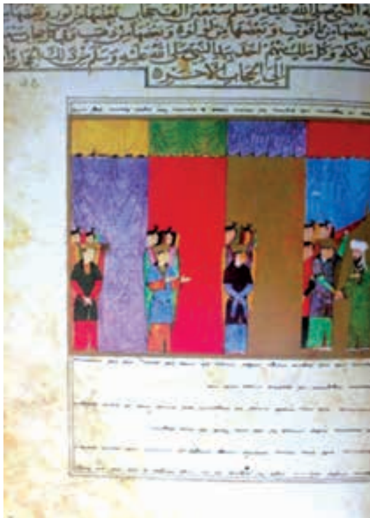
تصویر ۴- هفتاد هزار پرده، معراج نامه، هرات، ۸۴۰-۱۴۳۶، کتابخانه ملی پاریس