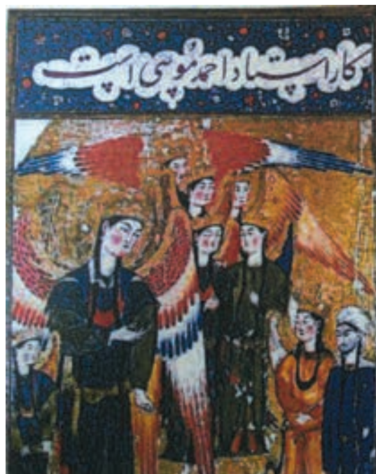
تصویر ۲- پیامبر و جبرئیل فرشته در مقابل یک فرشته عظیم الجثه ایستاده اند، رقم احمد موسی، معراج نامه تبریز، توپقاپی سرای استانبول

هنر اسلامی با کتابت قرآن کریم آغاز شد. چیزی نگذشت که پای نقش و نگارها به میان آمد، سرلوحه ها آراسته شد و سرآغاز سوره ها به حاشیه رنگین پیراسته شد و گرایش به ترجمه و نگارش متون علمی، تاریخی و ادبی در سده های بعد متجلی شد. تصاویر انسان، حیوان، گیاهان و نباتات به نسخه های دست نوشته راه یافت و استفاده از کاغذ به جای پوست برای کتابت راه را برای اعتلای کتاب آرای