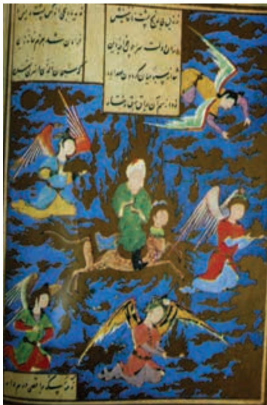
تصویر ۹- معراج، یوسف و زلیخا جامی، ۹۴۰ هجری قمری، کتابخانه قاهره

از نقاشی - طراحی که دارای ترکیب بندی های غیر پیچیده، منظره پردازی ساده و با زمینه رنگ پریده، علف ها و گیاهانی که به صورت قالبی و هندسی قرار می گیرند و با رنگ سبز و گیاهان زرد، پیکره های چاق با چهره گرد و ابروهای کمانی و دماغ ها و دهان های کوچک نقش داشته است. او مجموعه ای را به نام خاوران نامه نقاشی کرده است که یکی از تصاویر آن معراج پیامبر (ص) می باشد. (تصویر ۷) تنوع رنگ در تصویر زیاد است اما عمده رنگ های به کار رفته قرمز، آبی و طلایی می باشد و رنگ ها بیش تر به صورت خاکستری استفاده شده است. فرشته های اطراف اغلب یک شکل و یک اندازه به حالت خپل و کوتاه بادهان و بینی کوچک و ابروان کمانی تصویر شده اند و به نظر می رسد فقط از نظر رنگ و جهت نگاه با یکدیگر تفاوت دارند. حرکت حضرت پیامبر (ص) از سمت راست تصویر به داخل قاب است. ترکیب بندی تصویر به صورت حلزونی است و از فرشته ای که در سمت راست تصویر قرار دارد و دارای بال هایی به رنگ بنفش است شروع و به مرکز یعنی براق و فرشته ای که در بالای سر پیامبر قرار دارد، ختم می شود. با روی کار آمدن شاه اسماعیل صفوی در تبریز حکومت وی آغاز شد. در این زمان سلطان محمد، هنرمند معروف و خوش آوازه عرصه هنر ایران نیز می زیست