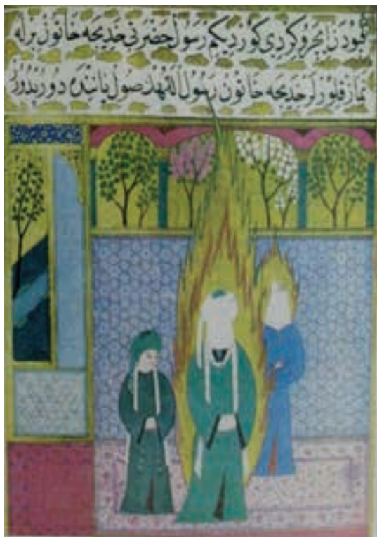
تصویر ۲۲- عثمانی، اولین نماز اسلام، سیرالنبی، مجموعه اسپنسر، کتابخانه ملی نیویورک