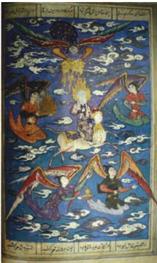
تصویر ۵- بدون عنوان، متعلق به نسخه خطی موجود در دارالکتب مصر، هرات، بدون رقم

همچنین اولین معراج نامه ای که تاکنون به دست آمده نیز متعلق به این دوره می باشد. به نظرمی رسد مولانا عبدالله آن را مثنی برداری کرده و نقاشی های آن منسوب به احمد موسی می باشد. این معراج نامه امروزه در مجموعه ای از نگاره های آلبوم بهرام میرزا در کتابخانه توپقاپی نگه داری می شود. (رهنورد، ۱۳۸۶، ۲۸) در این نسخه نخستین بار است که موجودات عجیب و غریب و ترکیبی ظاهر می شود. این نسخه با شاهنامه دموت شباهت هایی در عنصر منظره پردازی نامتراکم هم چون درختان بزرگ پیش زمینه دارد. پیکره های انسانی، با بدن طویل، سرهای بیضی شکل و اندام های آرام، عمامه های گردی که با دنباله های گشاد بر روی سینه مردان افتاده و روبان های آویزان فرشته ها، تداعی کننده ویژگی اواخر سده ۱۴ هجری قمری است.