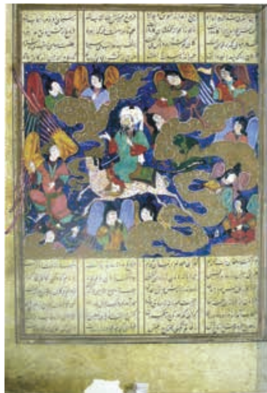
تصویر ۷- معراج حضرت رسول اکرم (ص)، خاوران‌نامه، رقم فرهاد، کاخ گلستان، تهران

را به زیبایی تصویر کرده است. (تصویر ۸) این تصویر معراج نامه جزء معدود آثاری است که براق در آن حضور ندارد و دلیل آن هم این است که نقاش می خواسته نشان دهد که براق و جبرئیل اجازه ورود به این محل را ندارند. انتخاب رنگ ها در این تصویر به گونه ای است که هریک نمادی از یک موضوع هستند، قرمز نشانه یاقوت آتشین، طلایی نماد نور و غیره است. عمده رنگ های مورد استفاده در تصویر قرمز، بنفش، طلایی، زرد و غیره است که این رنگ ها در قسمت های مختلف تصویر تکرار شده اند. تنها در یک جا رنگ سفید دیده می شود و آن هم رنگ عمامه حضرت پیامبر (ص) است که نشان گر پاکی ایشان است. قلم گیری های تصویر با رنگ های گرم انجام شده و از ویژگی های نقاشی این دوره است. همچنین عناصر تزئینی در تصویر دیده نمی شود و قسمت های مختلف تصویر و پیکره ها در نهایت سادگی ترسیم شده اند و فقط پرده ها اندکی تزئین شده اند.