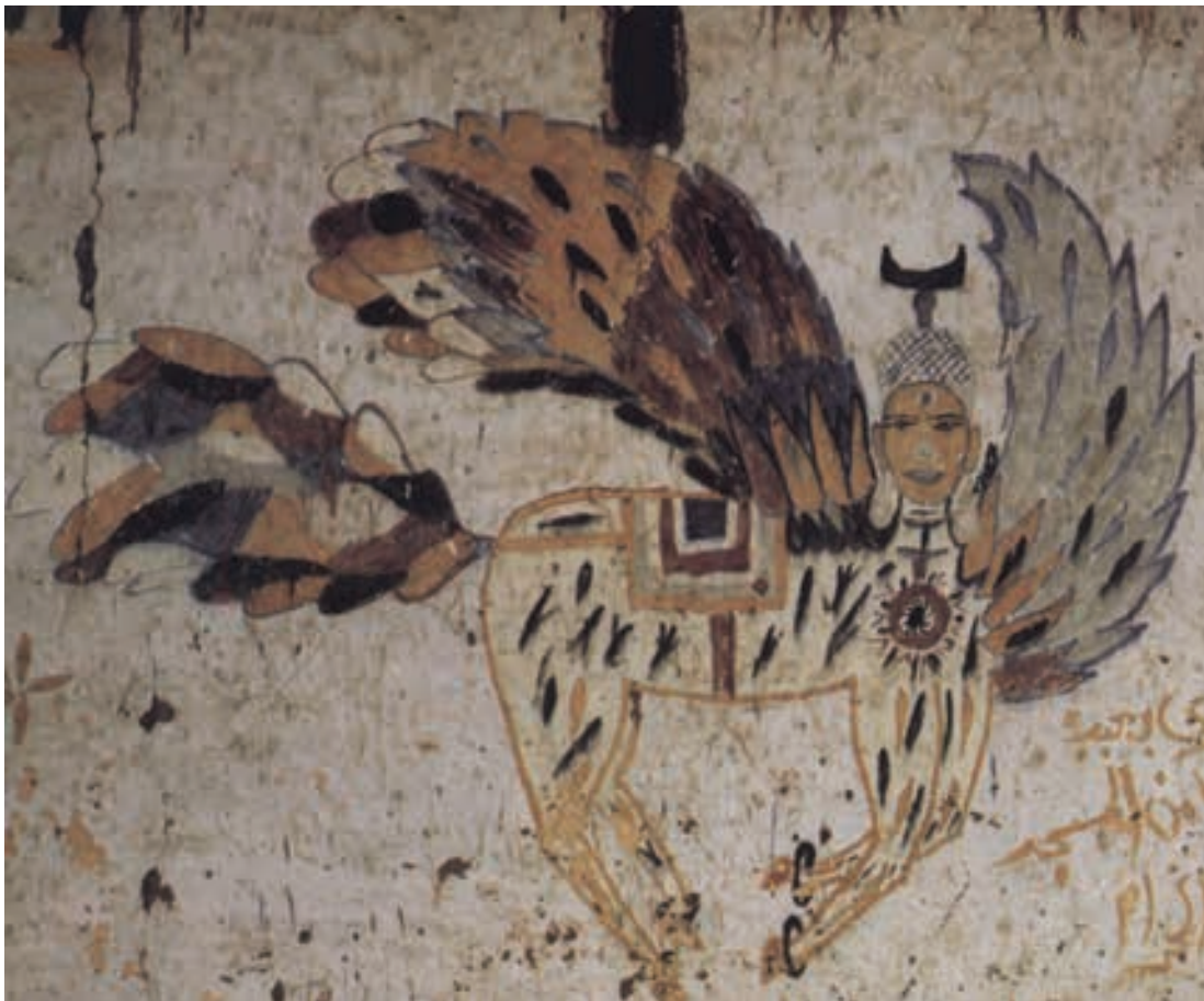
تصویر ۲۵- مصر، براق، هنر مردمی، بدون رقم