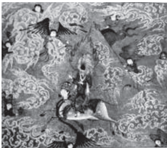
تصویر ۶- معراج حضرت محمد (ص)، خمسه نظامی، شیراز یا تبریز، بدون رقم، مکتب ترکمانان، حدود ۹۱۱ هجری قمری، کتابخانه ایندیافیس