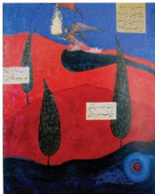
تصویر ۱۹-۱ معراج، عبدالمجید حسینی‌راد، فرهنگستان هنر، ۱۳۸۴، رنگ روغن روی بوم، ۱۴۰×۱۲۰ سانتی متر