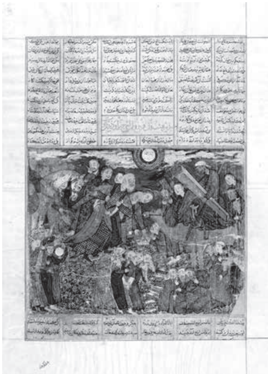
آوردن سر ایرج برای فریدون، شاهنامه بزرگ مغولی (دموت) ۷۳۶ هجری قمری، واشنگتن دی سی آمریکا، سالگرگاری