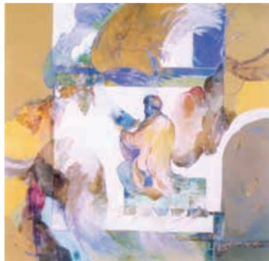
تصویر ۱۹-۳ معراج حبیب ا... صادقی، فرهنگستان هنر، ۱۳۸۴، ترکیب مواد ۱۰۰×۱۰۰ سانتی متر

وسایر عناصر دارای رنگ های گرم هستند. در این اثر برخلاف تمام تصاویر قبلی هیچ فرشته ای دیده نمی شود و هنرمند از به کارگیری شخصیت های اضافی خودداری کرده است.