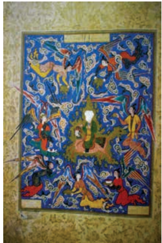
تصویر ۱۱: معراج، هفت اورنگ جامی، ۷۲-۹۳۶ هجری قمری، ابعاد ۲۳×۲۴ سانتی متر

تصویر شده، حرکت از راست به چپ می باشد. (تصویر ۹) در این تصویر ابرهای چینی سفید و خاکستری رنگ حذف شده و به صورت طلایی نمایان شده است. عمده رنگ به کار رفته در تصاویر نیز آبی، طلایی، قرمز و سفید می باشد. شاه طهماسب از اواخر دهه ۹۴۷ هجری قمری دست از حمایت نقاشان کشید و در سال ۹۵۵ هجری قمری و یا ۹۶۲ هجری قمری پایتخت خود را به قزوین منتقل کرد. در ربع سوم سده دهم هجری قمری برادرزاده او ابراهیم میرزا در مشهد تعدادی از نقاشان را به خدمت گرفت و نقاشی بار دیگر مورد حمایت دربار قرار گرفت. در نگاره‌های این زمان تلاش زیادی برای نشان دادن دوره جوانی شده است. تکامل شیوه خطی و رنگ آمیزی غنی و تاثیرگذار است. پس زمینه عموماً مسطح و گاه با چندگانه و ابر نقش شده‌اند. اما در اواخر سده دهم هجری قمری و اوایل سده یازدهم هجری قمری سبک دیگری از نقاشی که به ایالتی، تجاری خراسان و استرآباد (رابینسون، ۱۳۷۶، ۶۱) معروف شد، شکل گرفت.