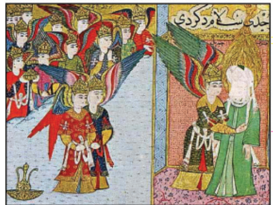
تصویر ۲۳- عثمانی، بی تاریخ، احتمالاً سیرالنبی، مجموعه اسپنسر، کتابخانه ملی نیویورک

در بسیاری از کتاب های تاریخ هنر در بررسی هنر تمدن های کهن، یا تمدن بین النهرین اولین مبحث قرار گرفته یا مصر.