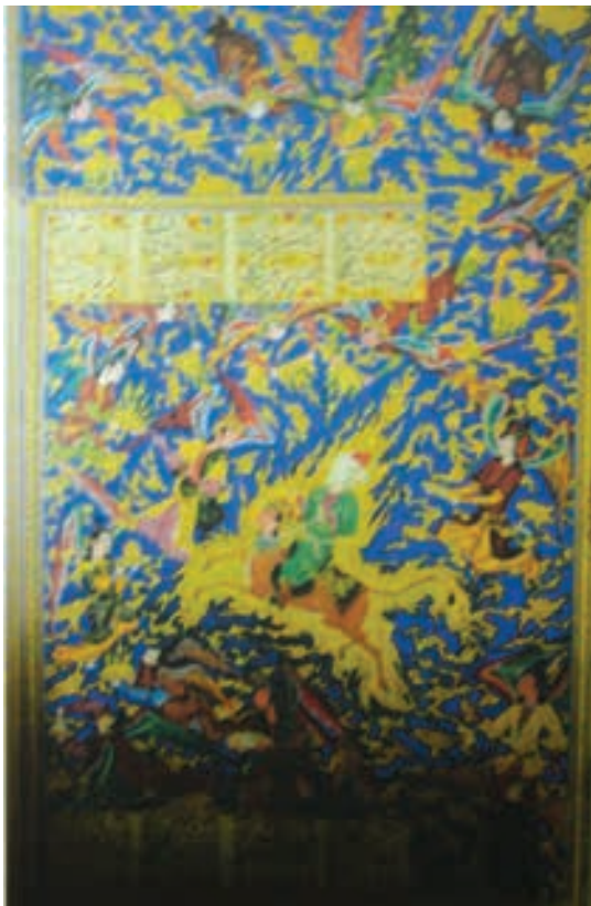
تصویر ۱۲- خمسه نظامی سال ۹۵۶ هجری قمری، هنرمند نامعلوم، مدرسه شهید مطهری