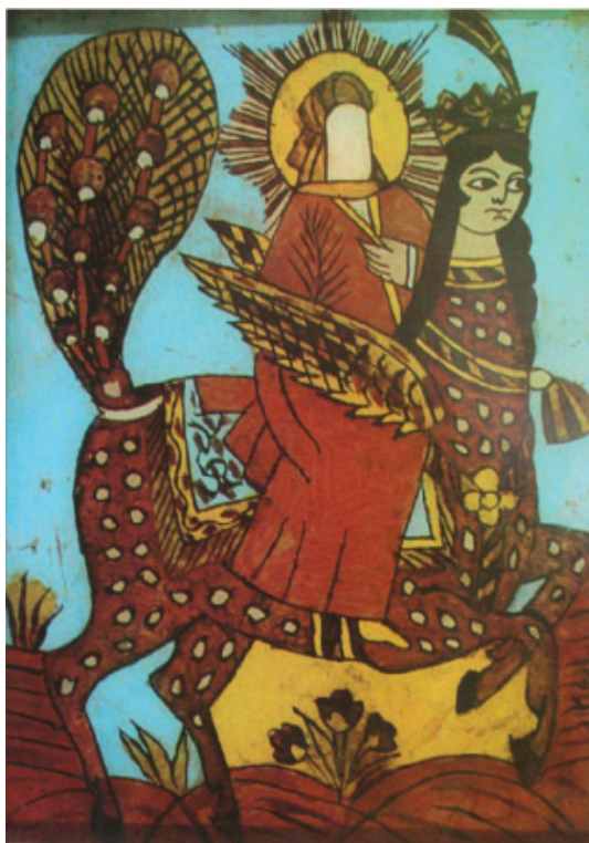
تصویر ۱۷- قاجار، معراج حضرت پیامبر اکرم (ص)، رنگ روغن پشت شیشه، ۱۹×۲۴ سانتی متر، بدون رقم، بدون تاریخ، مجموعه

می باشند. (همان، ۱۶۸-۱۶۲) در تصاویر به دست آمده از این دوران شاهد دیوارنگاره هایی با موضوع معراج هستیم که در حمام وکیل نقاشی شده است. (تصویر ۱۵) این دیوارنگاره ها بدون رنگ و تزئین کشیده شده و نقاش با پرهیز از هر نوع اضافه گویی به بیان واقعه معراج پرداخته است.