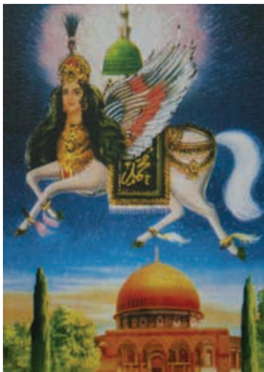
تصویر ۳۰- نیجریه، بدون رقم، بدون تاریخ

تصویر ۲۸- عربستان، معراج، بدون تاریخ، بدون رقم، اکریلیک روی بوم موجودی مونث می بینیم، عنصر تزئینی و توجه به جزئیات و استفاده زیاد از رنگ سبز از ویژگی های مشخص این کشور می باشد. (تصویر ۲۴) به دلیل تعصبات مذهبی نقاش از ترسیم تصویر حضرت محمد (ص) خودداری کرده و فقط حضور براق نشان از واقعه معراج دارد و محل قرارگیری آن به شکلی است که نشان می دهد بالاتر از سطح زمین قرار دارد و زمینه پشت سر حضرت پیامبر (ص) نیز به رنگ آبی نقاشی شده که تاکید بر آسمان دارد و نشان می دهد براق در آسمان حرکت می کند.