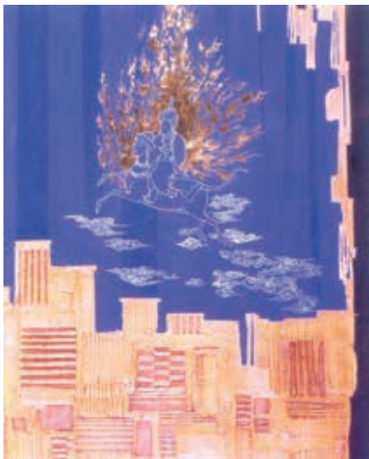
تصویر ۱۹-۲ معراج، ایرج، اسکندری، فرهنگستان هنر، ۱۳۸۴، ترکیب مواد، ۱۶۰×۱۰۰ سانتی متر