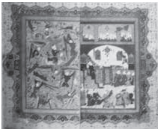
تصویر ۱۴- معراج، محمد زمان ۲۳/۵×۲۵ سانتی متر، قصص الانبیاء، ابراهیم ابن منصور نیشابوری