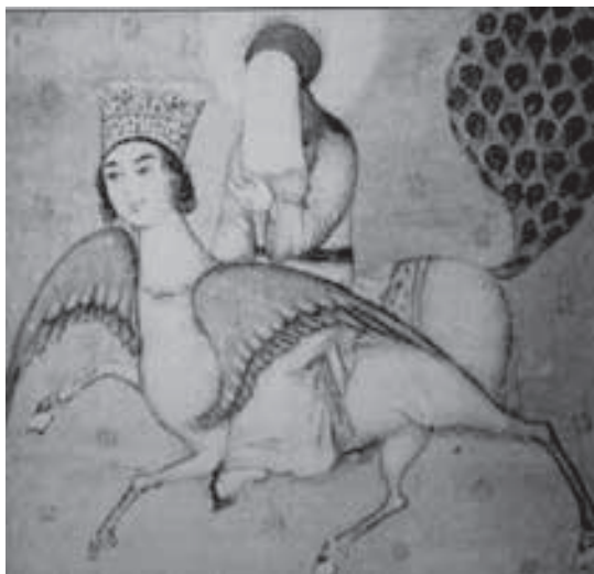
تصویر ۲۰-هند، براق، بدون رقم، بدون تاریخ