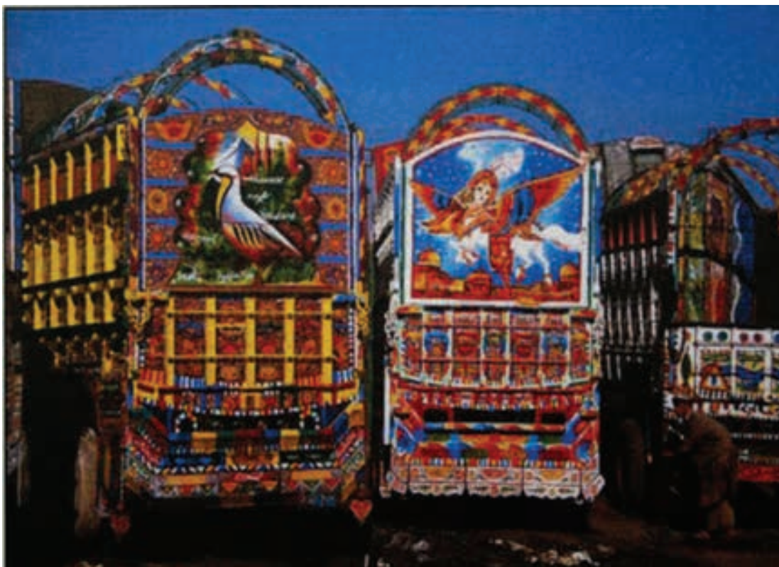
تصویر ۳۱- پاکستان، نقاشی بر روی ماشین، بدون رقم، بدون تاریخ