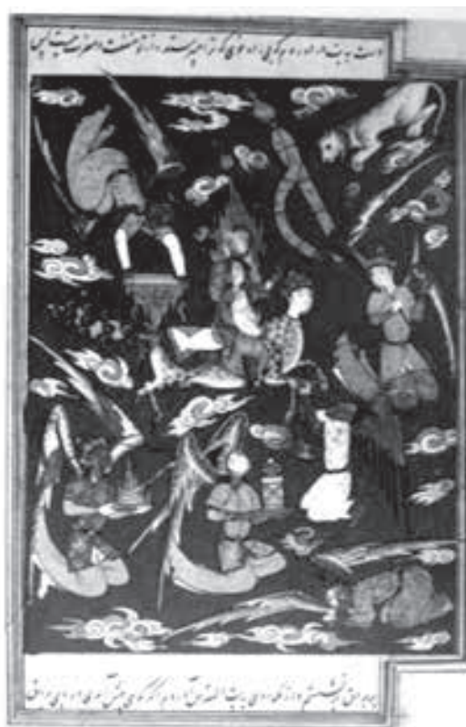
تصویر ۱۳- حضرت محمد(ص) در معراج، ۳۱/۸×۱۹/۵ سانتی متر

آمده (تصویر ۱۰) جبرئیل دیده نمی شود. حرکت براق از سمت راست به چپ تصویر می باشد و هاله ای نور اطراف حضرت پیامبر(ص) و براق را احاطه کرده است. این هاله به شکلی است که به صورت یکپارچه از پایین پای براق تا بالای سر حضرت پیامبر(ص) و اطراف ایشان در برگرفته است. عمده رنگ به کار رفته طلایی و آبی می باشد و جهت حرکت حضرت پیامبر(ص) از راست به چپ است. رنگ براق و پیامبر(ص) تیره کار شده و رنگ سفیدی که صورت و عمامه حضرت پیامبر(ص) را پوشانده و نیز کلاه سبز رنگی که بر سر براق گذاشته پاکی و طهارت را نشان می دهد. همچنین ترکیب بندی تصویر به صورت مارپیچ است.