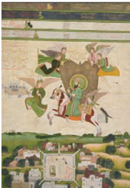
تصویر ۲۱- هند (دهلی)، معراج حضرت پیامبر(ص) احاطه شده با فرشتگان، ۱۸۰۰ میلادی، ۶۱/۵×۴۲/۵ سانتی متر

نقاشی، نگارگری، مجسمه سازی و غیره از دستاوردهای این دوران می باشد. (همان، ۱۸۸-۱۸۵) (مجموعه تصاویر ۱۹) نقاشی‌هایی با موضوع معراج در کشورهای اسلامی اهل تسنن اکثریت مسلمانان جهان را تشکیل می دهند. آن‌ها استفاده از صورتگری را برای نمایش تعالیم دینی و تاریخ اسلام جایز ندانسته و منع می کنند. اهل تسنن مخالف نصب تصاویر در مساجد هستند و هرگونه نقاشی یا پیکره‌ای که موجودات زنده را به نمایش بگذارد حرام می‌شمارند و معتقدند در هنر مقدس اسلام نقاشی پیکره، حیوانات و انسان جایز نیست.