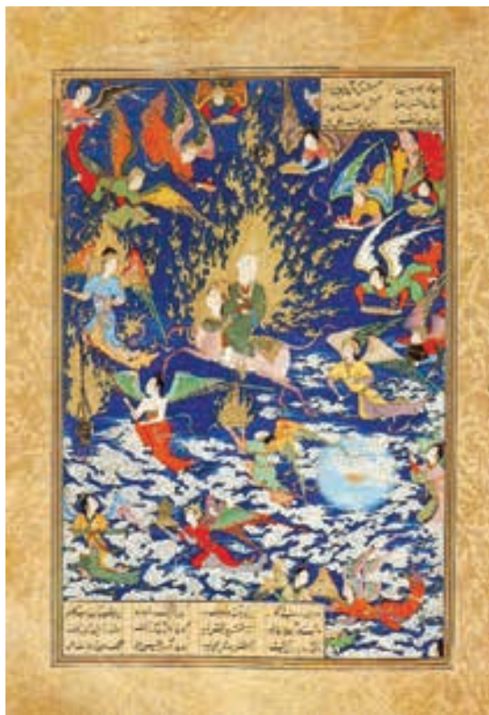
تصویر ۸- معراج، خمسه نظامی شاه طهماسبی، اثر سلطان محمد، تبریز ۹۴۶-۹۵۰ هجری قمری، کتابخانه بریتانیا لندن