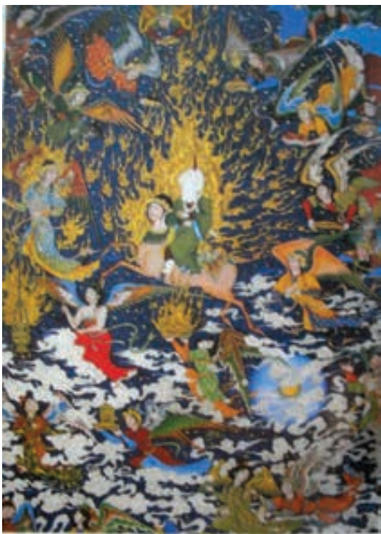
تصویر ۱۸- معراج، علی اکبر مطیع، برداشت از اثر سلطان محمد ۲۰/۵×۲۸ سانتی متر