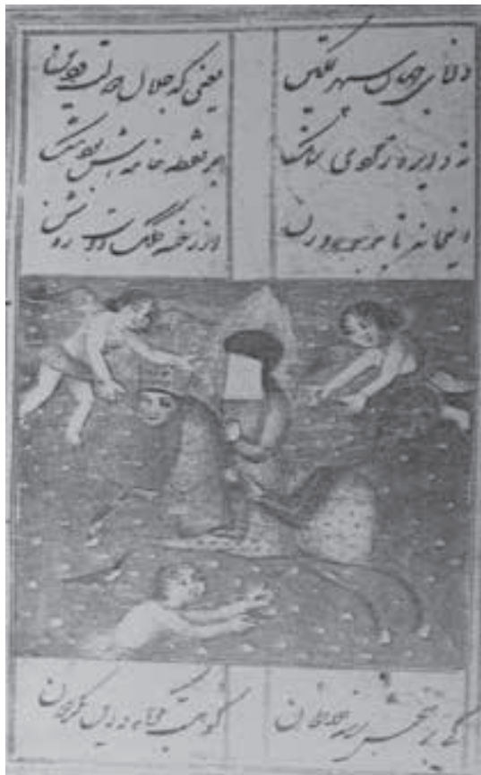
تصویر ۱۶- قاجار، بی نام، بدون رقم