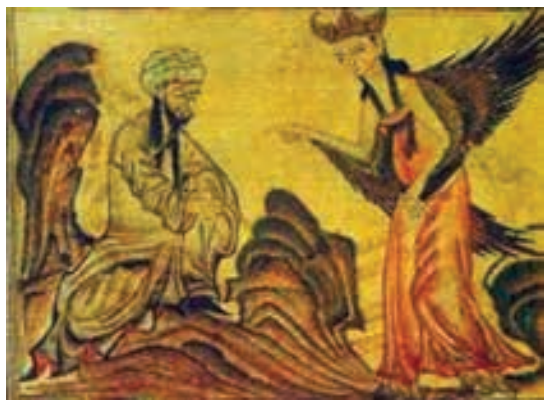
تصویر ۱- شب معراج، حضرت محمد(ص) بر روی براق، جامع التواریخ بدون رقم، بدون تاریخ، توپقاپی سرای استانبول