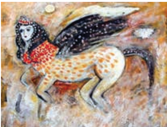
تصویر ۲۷- عراق، براق، بدون تاریخ، بدون رقم