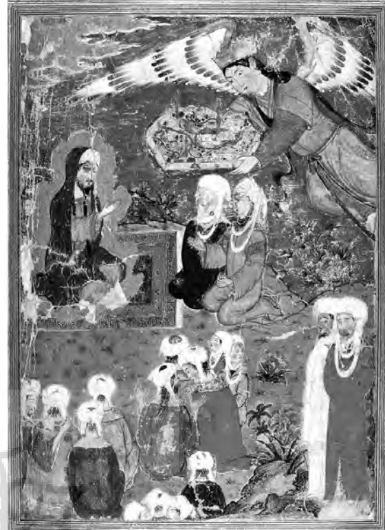
تصویر شماره ۲: آوردن سرزمین اسلام توسط جبرئیل برای پیامبر اکرم منسوب به استاد احمد موسی، مکتب تبریز دوم در دوره ایلخانان مغول

ایرانی در این آثار دیده می شود که با توجه به موضوعی فراواقعی، مانند واقعه معراج، بسیار نادر است. باز هم باید خاطر نشان کرد که این نوآوری در زمان خود به عنوان اولین نمونه های اعجاب انگیز در عرصه هنر نگارگری ایرانی می باشد. همنشینی سنت های چینی و ایرانی در کنار یکدیگر و استفاده هوشمندانه ی هنرمند ایرانی از عناصر هنر چین نظیر ابر، آب و کوه برای نشان دادن فاصله پلان ها و صلابت بخشی به صحنه ها بوده است.