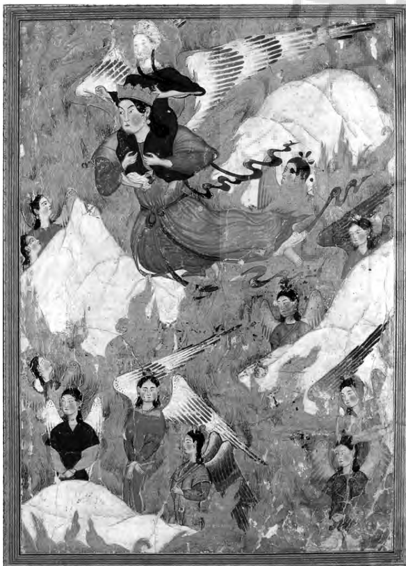
تصویر شماره ۱: پیامبر (ص) سوار بر دوش جبرئیل منسوب به استاد احمد موسی، مکتب تبریز اول در دوره ایلخانان

نکته قابل ذکر در اینجا این است که ادامه سنت های