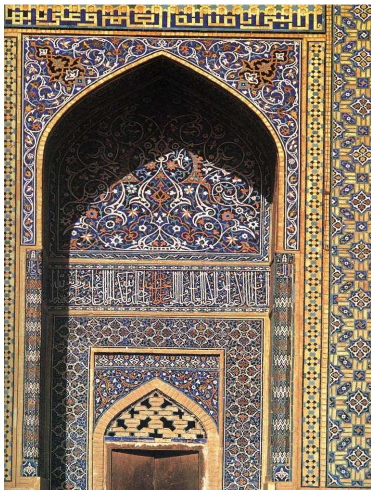
تصویر ۳. «أنا مدينة العلم و علیٰ بابها»، مسجد جامع، خط کوفی، دوره صفویه، اصفهان، (شایسته‌فر، ۱۳۸۴: ۱۹۵)