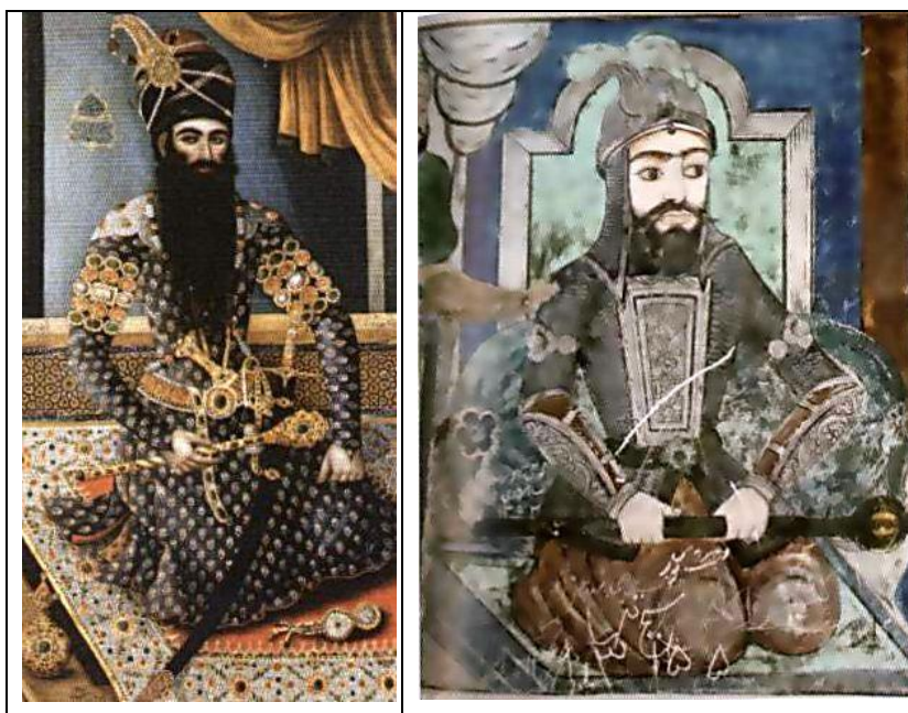
تصویر ۵. مقایسه تصویر مختار ثقفی از بقعه آقا سید حسین لنگرود با تصویر فتحعلیشاه اثر میرزاابابا، (میرزایی‌مهر، ۱۳۸۶: ۱۱۲).