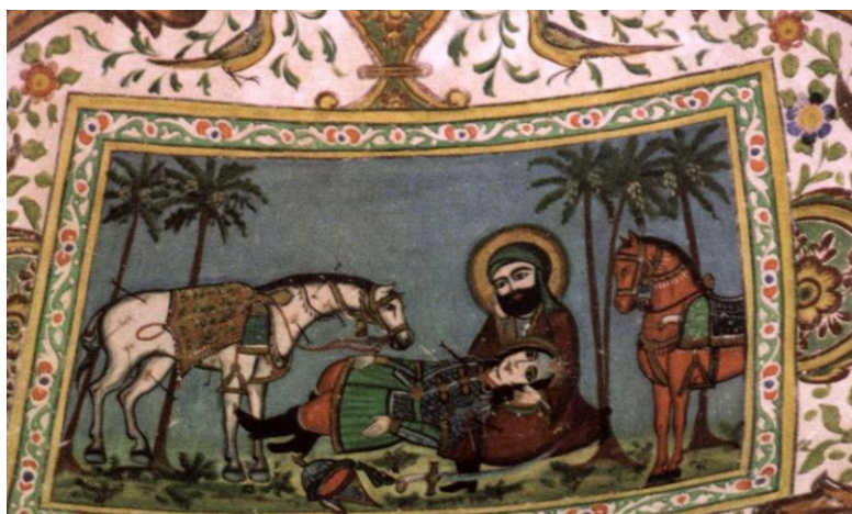
تصویر ۴. نقاشی امام حسین بر بالین علی اکبر قبل از شهادت (نمای داخلی)، بقعه قادر پیغمبر، بابولی، دیلمان (میرزایی مهر، ۱۳۸۶: ۴۵)

نقاشی‌های بقاع از سرچشمه‌های متفاوت تأثیر پذیرفته‌اند. هنر باستان (نقش برجسته‌های به‌جا مانده)، نگارگری عهد تیموری و به‌ویژه صفوی، نقاشی‌های اروپایی (دیوارنگاره‌های کلیسا)، پرده‌درویشی‌ها (پرده‌های نقالی)، کتاب‌های چاپ سنگی و شمایل‌نگاری مکتب زند و قاجار از سرچشمه‌های الهام در نقاشی‌های بقاع بوده است. در دو تصویر ۵ و ۶ تأثیرپذیری این نقاشی‌ها را از معراج‌نامه و مکتب قاجار به‌خوبی می‌توان دید.