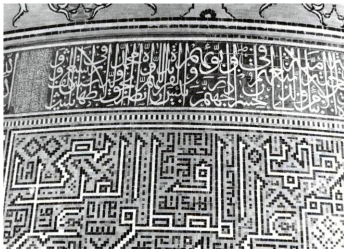
تصویر ۲. مسجد جمعه اشترجان، مدخل اصلی شمال شرقی، حدود ۷۱۵ ه. ق. (سوشک، ۱۳۷۹: ۱۶۶)

نمونه‌ای مشابه در کاشی‌کاری مدرسه آل مظفر در داخل مسجد جمعه اصفهان دیده می‌شود. این مدرسه در ۷۶۸ هجری، در دوران حکومت آل مظفر در اصفهان ساخته شد. سطح ایوان این مدرسه از دو شبکه چهارخانه پوشیده شده که یکی بر روی دیگری قرار گرفته است. به این ترتیب، مجموعه‌ای از ستاره‌های هشت پر پدید آمده که درهم بافته شده‌اند. علاوه بر این، مجموعه‌ای از ستاره‌های هشت پر که با کاشی معرق کامل شده است، بر زیبایی نمای ایوان افزوده‌اند. این ستاره‌ها کاملاً از نمای آجری کنده شده و برجستگی یافته‌اند. ستاره‌های موجود در رأس و انتهای تاق قوسی نقش اسلیمی دارند، ولی ستاره‌های میانی دارای هشت کتیبه مربعی‌اند که یک ستاره هشت پر دیگر را احاطه کرده‌اند و در وسط نیز شمشه‌ای قرار گرفته است که در آن خوشنویسی شده است. در مربع‌ها، در جهت حرکت عقربه‌های ساعت، نام‌های الله، محمد، ابوبکر، عمر، عثمان، علی، حسن و حسین نگاشته شده‌اند. آوردن نام حسن و حسین در میان این کتیبه‌ها نیز به خوبی از عقاید شیعی اهداء‌کننده مدرسه خبر می‌دهد. با این حال، هنوز اعتقاد به خلفای راشدین دیده می‌شود که نشان از فضای سیاسی و دینی زمانه دارد.