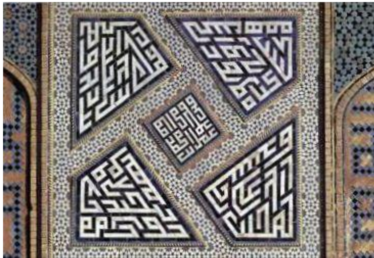
تصویر ۸. در ستایش امام علی (ع)، حیاط مسجد جامع، خط کوفی بنایی، اصفهان (شایسته‌فر، ۱۳۸۴: ۱۷۵)

مسجد به کار رفته‌اند. دسته سوم، کتیبه‌هایی‌اند که به امام علی (ع)، حضرت فاطمه (س) و امام حسن و امام حسین و دیگر امامان اختصاص دارند. این گروه را می‌توان به سه زیرگروه تقسیم کرد: اول کتیبه‌هایی در ستایش حضرت علی (ع)‌اند. دوم، آنهایی که حضرت فاطمه (س) و دو فرزندش را ستایش می‌کنند و آخرین دسته آنها که دوازده امام را ستایش می‌کنند. در تصویر ۸ نمونه‌ای از کتیبه‌های عصر صفوی را در صحن عباسی حرم مطهر امام رضا (ع) در مشهد می‌توان دید.