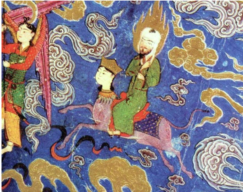
تصویر شماره ۷: تصویر پیامبر سوار بر براق در شب معراج در نمای بیرونی امامزاده زین‌الدین، یزدلان (میرزایی‌مهر، ۱۳۸۶: ۵۵)